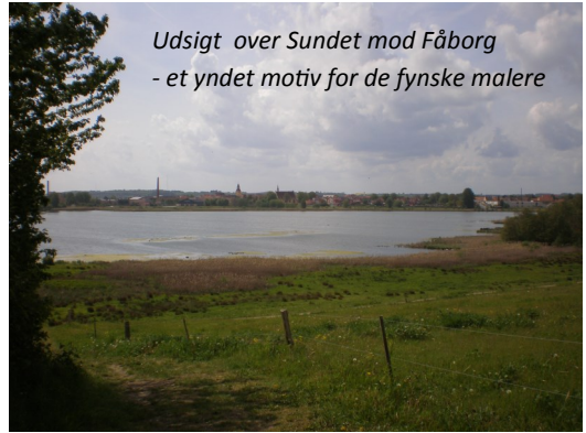
Udsigt over Sundet mod Fåborg - et yndet motiv for de fynske malere

Efter frokosten kører vi til Diernæs Kirke og den nærliggende Finstrup Kirkeruin (Fyns eneste kirkeruin). Turen fortsætter op i de naturskønne Fynske Alper. Afhængig af vejret drikker vi eftermiddagskaffe et kønt sted i "alperne" eller i bussen. Vi er tilbage ved Hårslev Kirke ca. kl. 15.30.